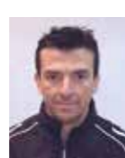
監督 ジョン・シアン